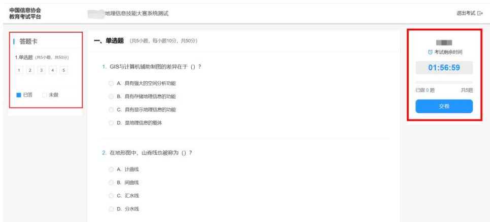
考试平台示意图（仅供参考，具体以实际考试为准）

完成线上考试后，在考试平台右侧点击“ 交卷 ”，即可完成交卷。请各参赛选手务必检查考试平台左侧“ 答题卡 ”，查看是否有漏答，并记得点击右侧“交卷”，以免影响您的成绩。