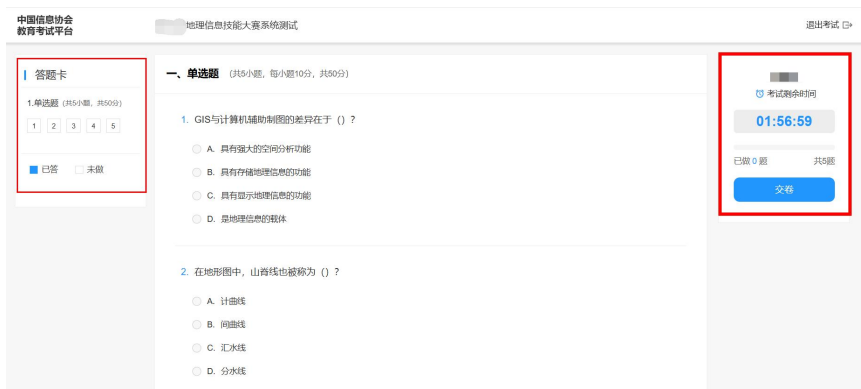
考试平台示意图（仅供参考，具体以实际考试为准）

完成线上考试后，在考试平台右侧点击“ 交卷 ”，即可完成交卷。请各参赛选手务必检查考试平台左侧“ 答题卡 ”，查看是否有漏答，并记得点击右侧“交卷”，以免影响您的成绩。